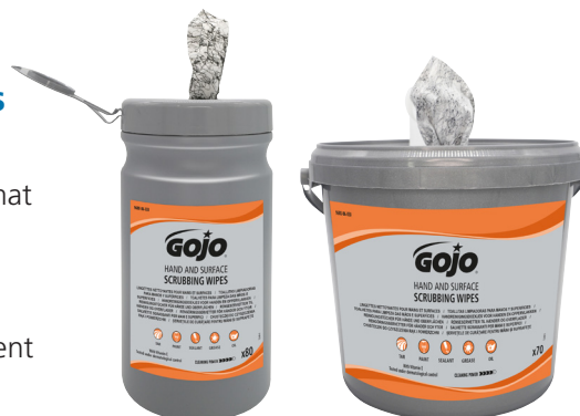
Boîte de 80: 9680-06-EEU

Lingettes imprégnées à double texture : un côté abrasif pour éliminer les taches tenaces et un côté doux pour laisser les mains douces. Format extra-large pour nettoyer les mains, les bras, les outils et les surfaces. Formule nettoyante et dégraissante qui a une bonne compatibilité cutanée. Utilisation partout où il faut nettoyer des salissures tenaces ; utilisation sans eau et adapté utilisation dans divers secteurs notamment le bâtiment, l'industrie et l'automobile.