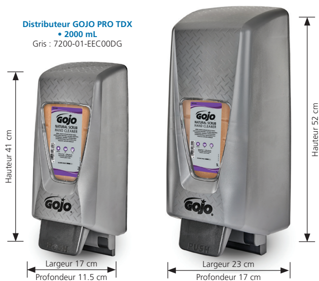
Distributeur GOJO PRO TDX • 2000 mL Gris : 7200-01-EEC00DG